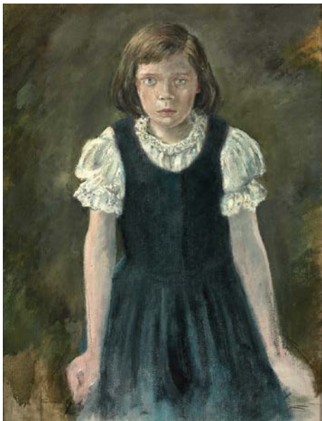
Mädchenbildnis Sibylle, 1953, unvollendet, Öl auf Leinwand, 84,5 x 65,0 cm, Akademie der Künste, Berlin, Kunstsammlung, Otto Nagel, Inv.-Nr. KS-Nagel MA 23