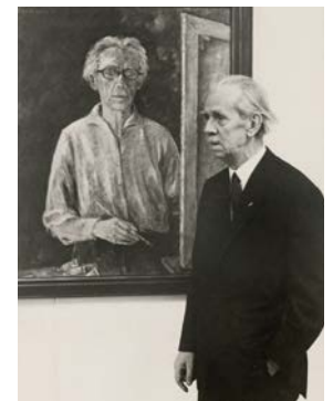
Otto Nagel 1966 in der Ladengalerie vor seinem Gemälde „Der alte Maler“.

Am Ende bleibt das Bild eines Künstlers zwischen Anpassung und Widerstand, der aber in seiner Porträtkunst bis an das Ende seines Lebens nur seiner eigenen Wahrnehmung vertraute. ■