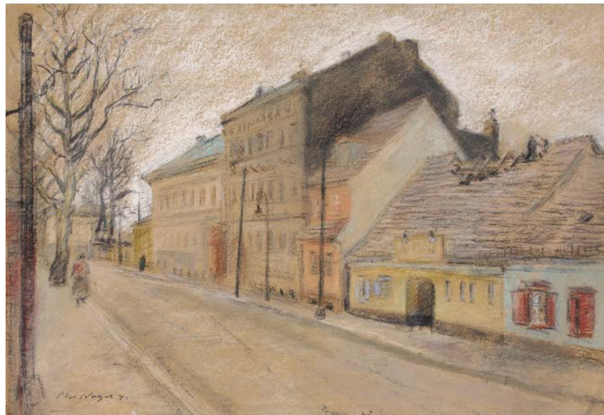
Lokal Gibbecke in Alt-Strahlau, 1941, Pastell, 41,2 x 61,2 cm Akademie der Künste, Berlin, Kunstsammlung, Otto Nagel, Inv.-Nr. KS-Nagel C 322