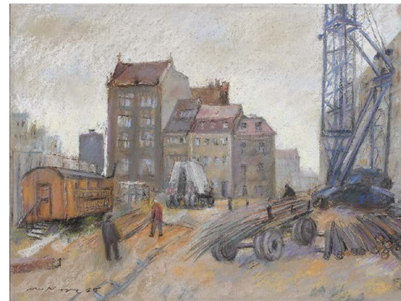
Am Köllnischen Fischmarkt, 1965, Pastell, 45,0 x 60,0 cm Akademie der Künste, Berlin, Kunstsammlung, Otto Nagel, Inv.-Nr. KS-Nagel MA 41

„Das Werk eines Künstlers ist keine Maschine, wo jedes Teil eine bestimmte Funktion hat und sich genau mit der Mikrometerschraube messen und durch Brechungen in seiner Wirkung festlegen lässt.“